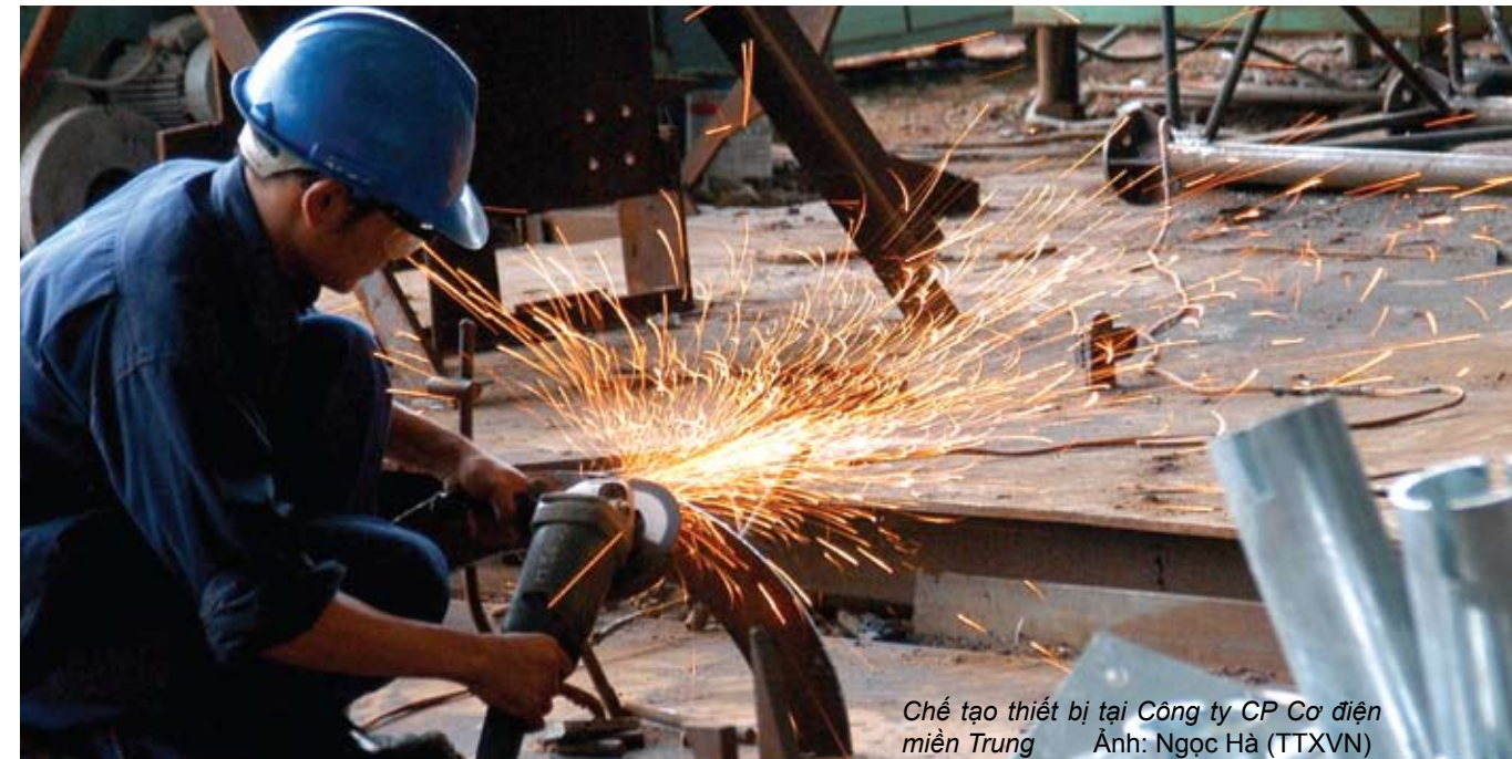
Chế tạo thiết bị tại Công ty CP Cơ điện miền Trung

Đặc biệt, năm 1992, Bộ Chính trị, Chính phủ quyết định xây dựng hệ thống tải điện 500 kV Bắc - Nam với chiều dài 1.487 km và 4 trạm biến áp 500 kV, tổng vốn đầu tư 5.300 tỉ đồng. Chỉ sau 2 năm vừa thiết kế, vừa thi công, công trình được đưa vào vận hành ngày 27/5/1994, là một công trình lớn bậc nhất vào thời điểm đó, lại hoàn thành trong một thời gian ngắn. Đây thực sự là một kỳ tích đáng tự hào của đất nước, trong đó có ngành Điện. Sự kiện quan trọng này đã đánh dấu bước trưởng thành mang tính đột phá của ngành Điện Việt Nam về công nghệ truyền tải và điều khiển hệ thống điện. Hệ thống điện quốc gia từ đây được hình thành trên cơ sở liên kết lưới điện các miền Bắc - Trung - Nam thông qua trục "xương sống" là đường dây 500 kV, giải quyết kịp thời tình trạng thiếu điện trong giai đoạn này ở miền Trung và miền Nam, đồng thời cho phép khai thác tối ưu, hiệu quả nguồn