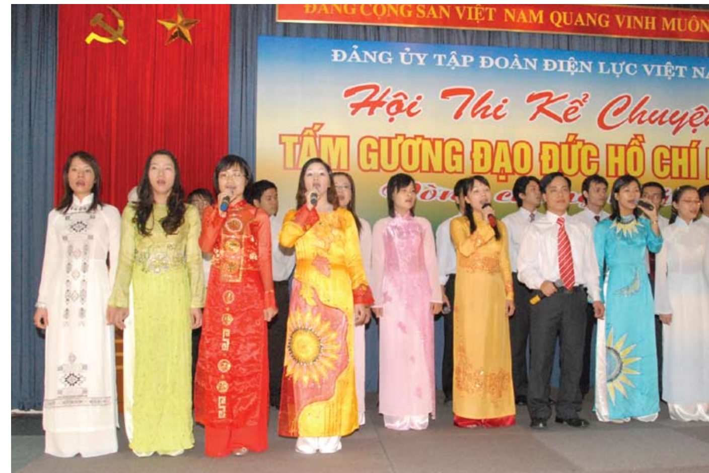
Dù Bác Hồ đã đi xa, nhưng hình ảnh của Người vẫn luôn còn sống mãi trong trái tim hàng triệu người Việt Nam

Khoảng 9h, một cơn đau đột ngột làm cho Bác phải quặn nghiêng người và cử thể lịm dần. Máy điện tim chỉ còn thoi thóp và chạy ngang với những đường sáng nhấp nhô yếu ớt. Lúc này, các thầy thuốc Trung Quốc từ từ lần lượt lui ra ngoài.