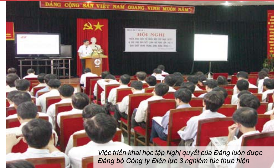
Việc triển khai học tập Nghị quyết của Đảng luôn được Đảng bộ Công ty Điện lực 3 nghiêm túc thực hiện

Liên tục trong những năm qua, cán bộ, đảng