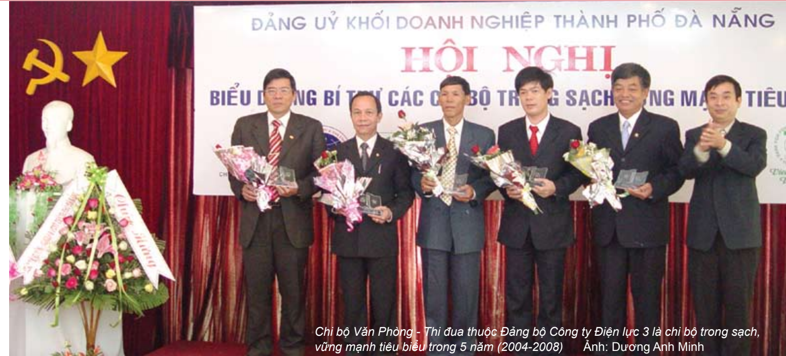
Chi bộ Văn Phòng - Thi đua thuộc Đảng bộ Công ty Điện lực 3 là chi bộ trong sạch, vững mạnh tiêu biểu trong 5 năm (2004-2008)

Dẫu vậy, Công ty vẫn xác định Cuộc vận động này không chỉ trong một thời gian ngắn, mà hiệu quả và giá trị sẽ là mãi mãi, bởi vậy sẽ còn nhiều việc phải làm như: Hình thành thói quen tiết kiệm trong toàn Công ty, sử dụng hiệu quả vật liệu phụ trong sửa chữa để tiết kiệm, hạn chế rác thải, bảo vệ môi trường cho đến sử dụng hợp lý thời gian, nguồn lực.... Tin rằng, khi đã “đọc thật kỹ, hiểu thật sâu” thì CBCNV Công ty Thủy điện Ialy sẽ làm thật đúng lời dạy của Người. ■