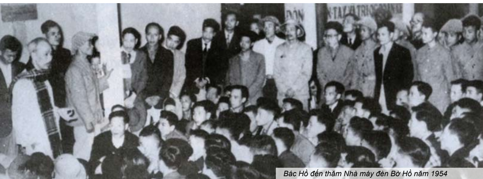
Bác Hồ đến thăm Nhà máy đèn Bờ Hồ năm 1954