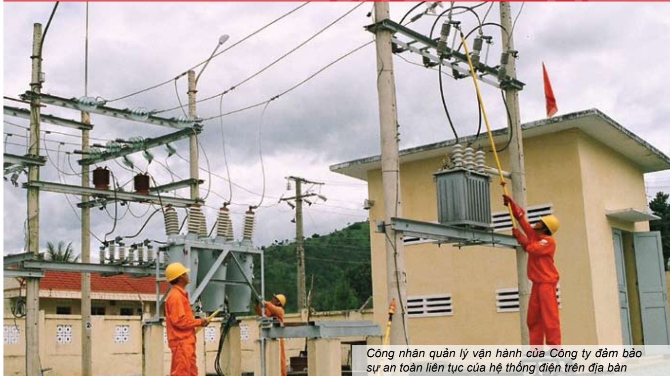
Công nhân quản lý vận hành của Công ty đảm bảo sự an toàn liên tục của hệ thống điện trên địa bàn