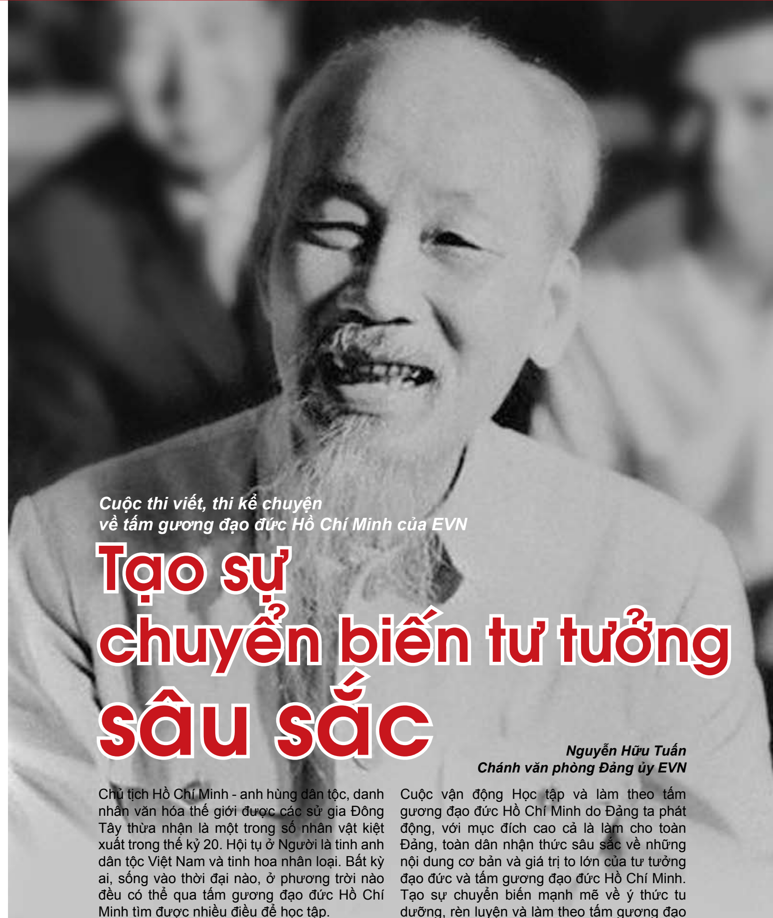
Cuộc thi viết, thi kể chuyện về tấm gương đạo đức Hồ Chí Minh của EVN

Những kết quả bước đầu thiết thực đó cũng là cơ sở quan trọng để Đảng ủy, các cấp ủy trong Tập đoàn triển khai tốt hơn Cuộc vận động trong những năm tiếp theo. Suốt đời phấn đấu, học tập và làm theo những đức tính giản dị mà cao đẹp của Bác, trở thành nếp nghĩ, cách làm của mỗi cán bộ đảng viên, công nhân viên chức Tập đoàn Điện lực Việt Nam trong hành động thực tiễn hàng ngày, thực sự góp phần xây dựng Tập đoàn ngày một phát triển, xây quê hương, đất nước đẹp giàu, xây dựng xã hội công bằng, dân chủ, văn minh như lúc sinh thời Bác hằng mong đợi,... đó chính là biểu hiện cao đẹp nhất để hướng về Người. ■