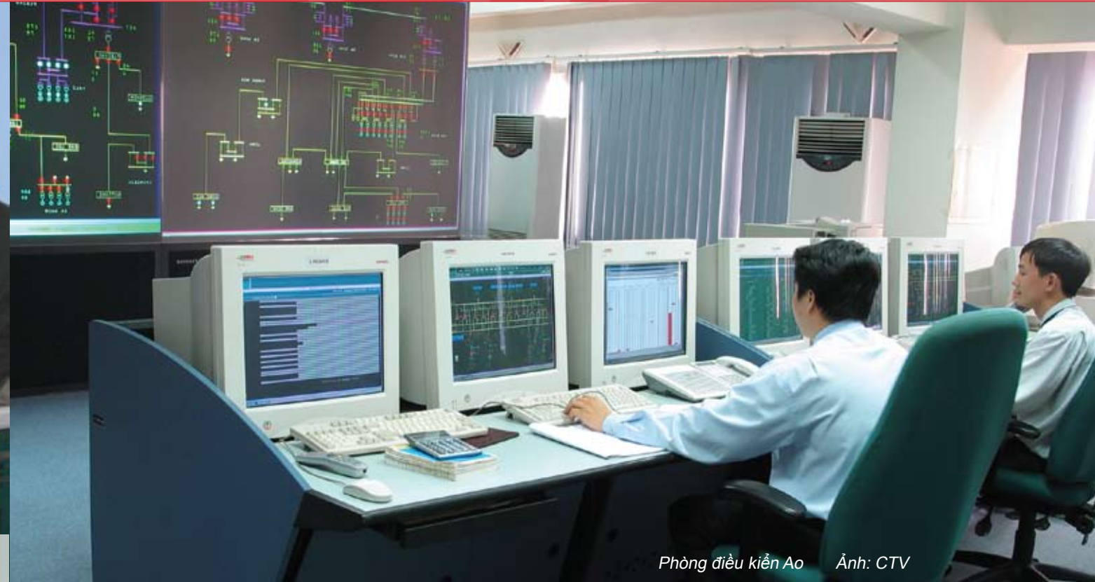
Phòng điều khiển Ao

Đảng bộ Trung tâm Điều độ Hệ thống điện Quốc gia