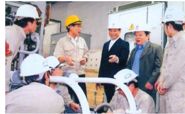
Lãnh đạo Công ty kiểm tra công tác sửa chữa, bảo dưỡng thiết bị

Nhằm nâng cao vai trò lãnh đạo của Đảng, Đảng bộ Công ty sẽ thực hiện duy trì nghiêm chế độ sinh hoạt của Đảng, thường xuyên