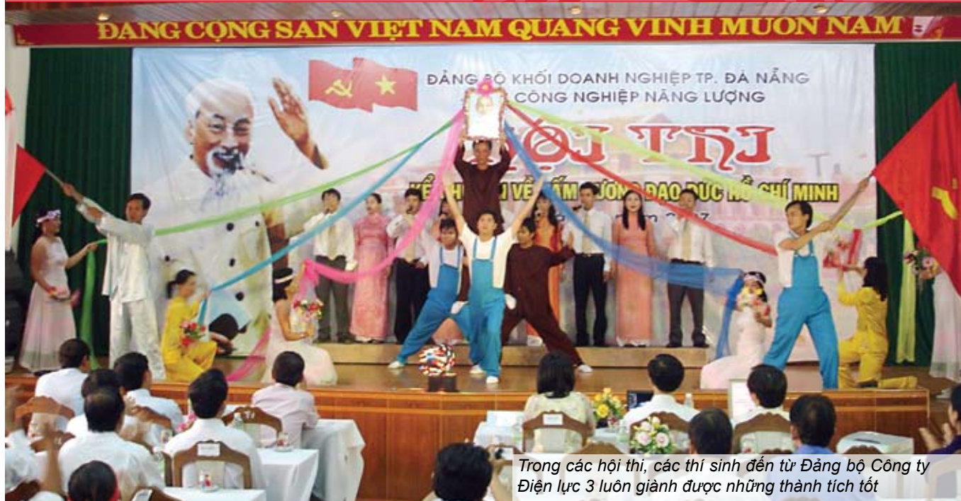
Trong các hội thi, các thí sinh đến từ Đảng bộ Công ty Điện lực 3 luôn giành được những thành tích tốt

quần chúng tham gia góp ý đối với cán bộ, đảng viên trong Đảng bộ về phẩm chất đạo đức và lối sống.