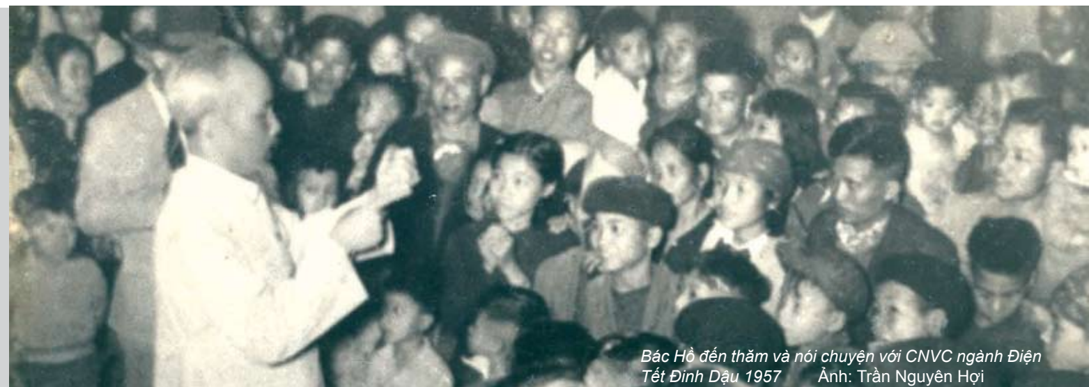
Bác Hồ đến thăm và nói chuyện với CNVC ngành Điện Tết Đinh Dậu 1957.

Chủ tịch Hồ Chí Minh, lãnh tụ kính yêu của dân tộc ta, đã hiến dâng tất cả tình cảm, trí tuệ và cuộc đời cho sự nghiệp cách mạng của Đảng và nhân dân ta. Người đã để lại tài sản vô giá là tư tưởng và tấm gương đạo đức trong sáng, mẫu mực, cao đẹp, kết tinh những giá trị truyền thống của dân tộc, của nhân loại và thời đại. Học tập và làm theo tấm gương đạo đức của Bác là niềm vinh dự và tự hào đối với mỗi cán bộ, đảng viên ngành Điện lực nói riêng và mỗi người Việt Nam nói chung.