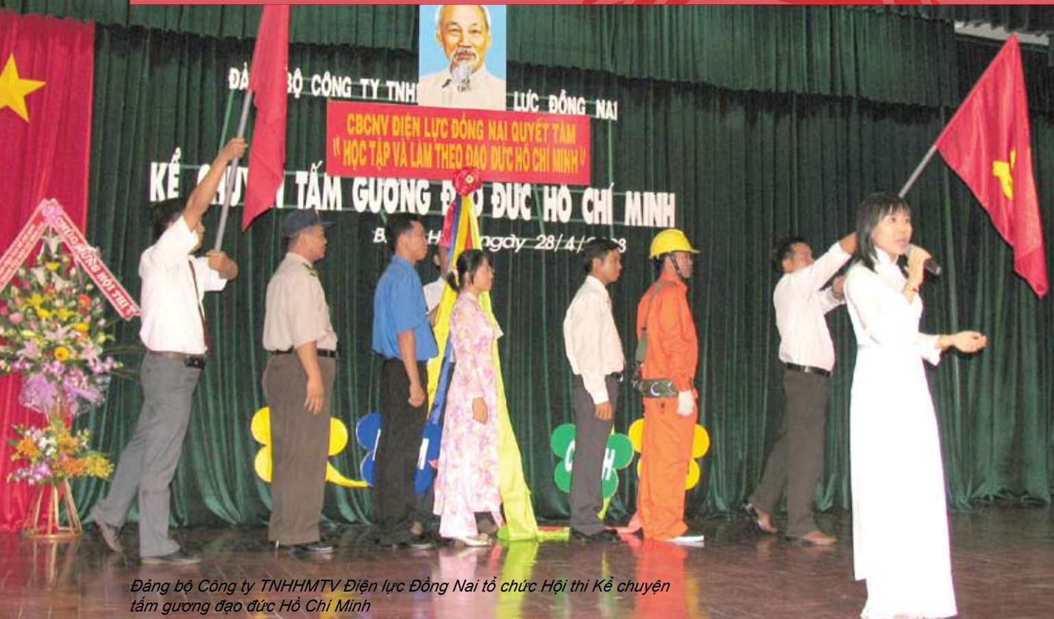
Đảng bộ Công ty TNHH MTV Điện lực Đồng Nai tổ chức Hội thi Kể chuyện tấm gương đạo đức Hồ Chí Minh