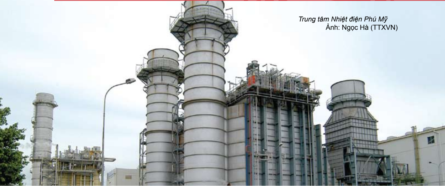
Trung tâm Nhiệt điện Phú Mỹ

liệt, tỷ lệ tổn thất điện năng đã giảm từ 21,4% năm 1995 xuống mức một con số (9,21%) năm 2008, bình quân mỗi năm giảm được 0,93%.