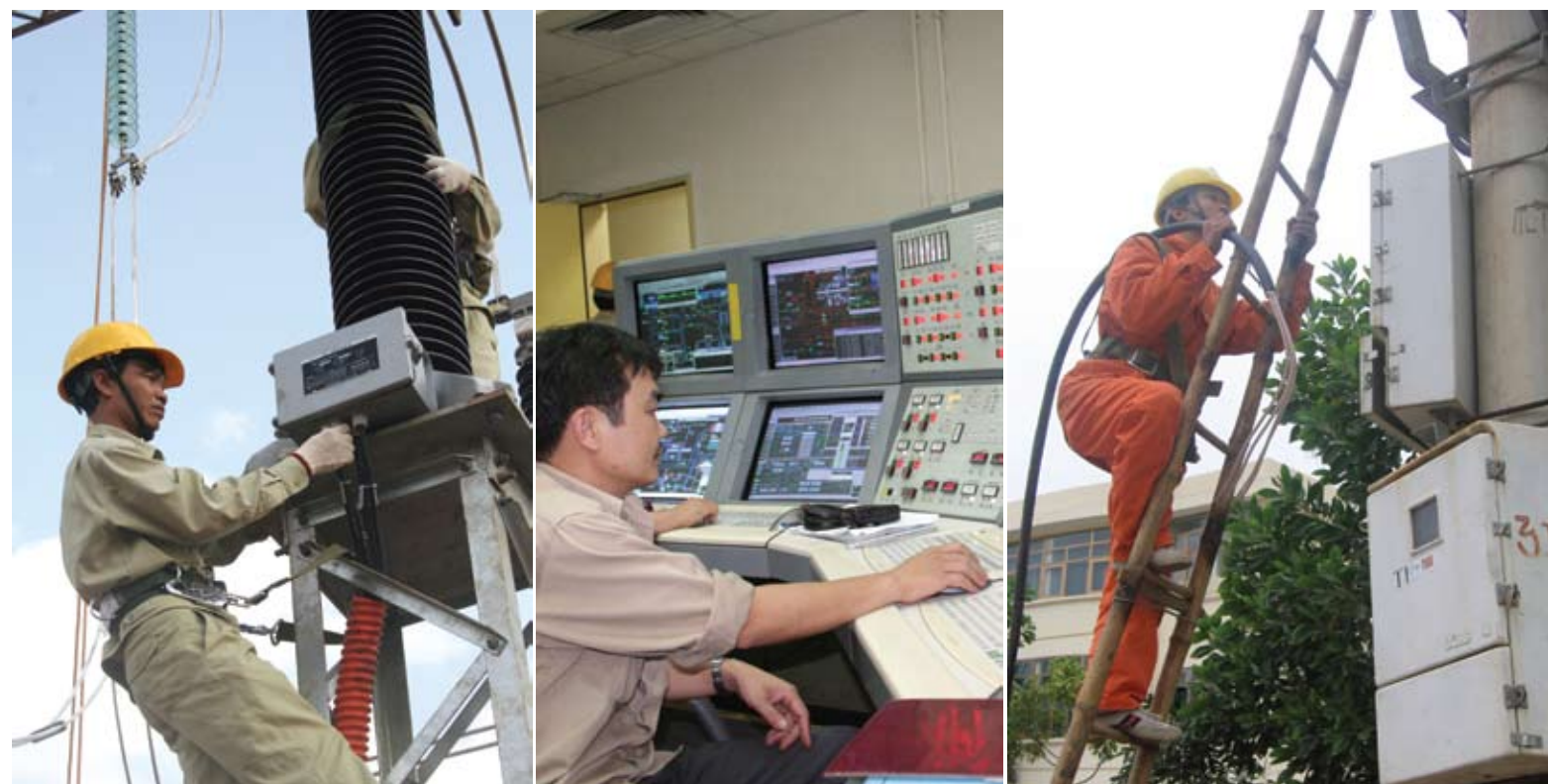
Dù ở vị trí nào, mỗi CBCNV Điện Lực Việt Nam đều nỗ lực làm theo lời Bác

• Ngày nay, trong điều kiện toàn cầu hóa, việc mở rộng tình đoàn kết quốc tế, hợp tác cùng có lợi, chủ động, tích cực hội nhập là một nguồn lực quan trọng để xây dựng và phát