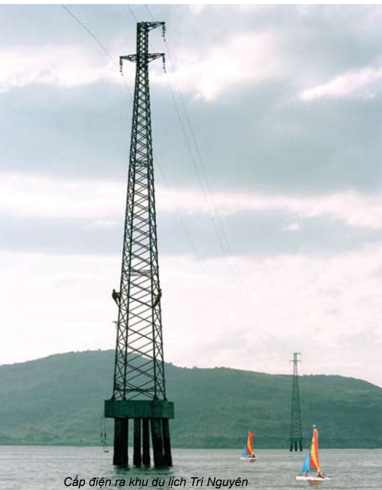
Cấp điện ra khu du lịch Trí Nguyên

tiết kiệm; thường xuyên cải tiến nắm bắt, cập nhật thông tin về khách hàng, từ đó áp giá điện nhanh chóng và chính xác, tránh nhầm lẫn, gây phiền hà... đã làm giảm đáng kể các thắc mắc của khách hàng sử dụng điện. Ngoài ra, Công ty đã triển khai lắp đặt công tơ nhiều giá, thực hiện hợp lý cắt điện công tác trên lưới và cắt điện do yêu cầu tiết giảm của điều độ Ao khi thiếu nguồn... góp phần tăng giá bán điện bình quân, từ đó tăng lợi nhuận.