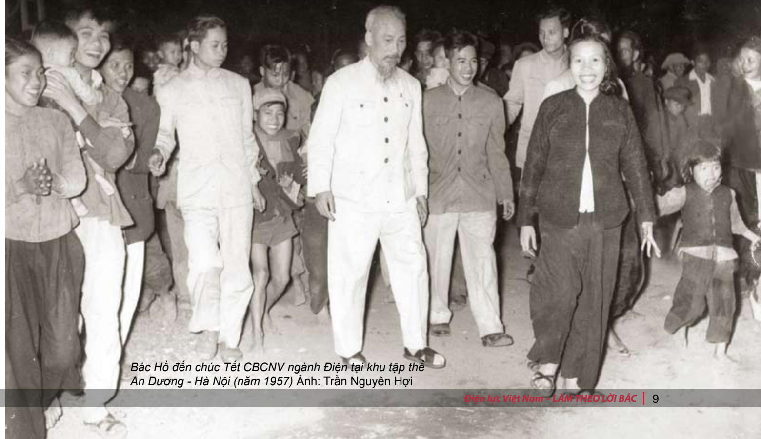
Bác Hồ đến chúc Tết CBCNV ngành Điện tại khu tập thể An Dương - Hà Nội (năm 1957)

Chúc các cô, các chú mạnh khỏe, vui vẻ và đoàn kết thi đua cho tốt!". ■