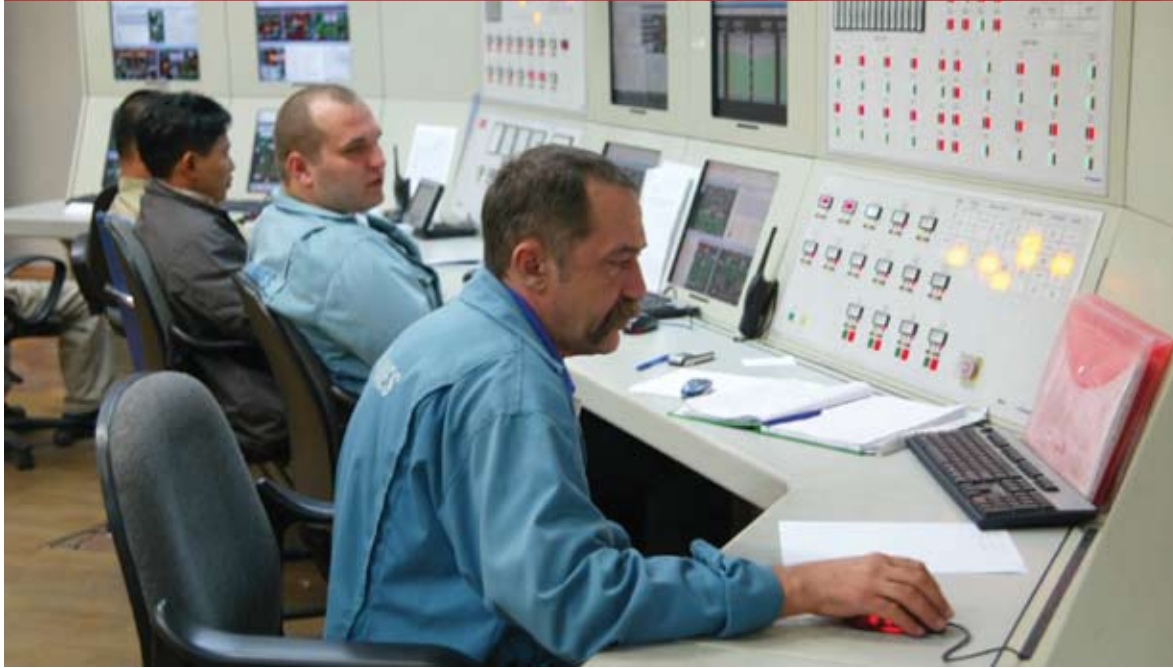
Chuyên gia nước ngoài đang vận hành Nhà máy Nhiệt điện Uông Bí mở rộng 1