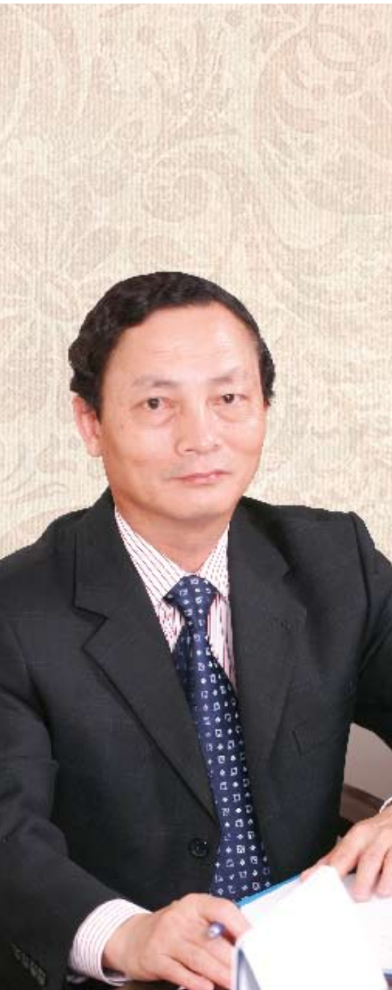
Đồng chí Đào Văn Hưng - Bí thư Đảng ủy, Chủ tịch HĐQT EVN

Tin tưởng rằng, bằng tinh thần tự giác nỗ lực phấn đấu, tấm lòng trân trọng vị lãnh tụ kính yêu của dân tộc và niềm tin sâu sắc vào sự lãnh đạo của Đảng Cộng sản Việt Nam quang vinh, Tập đoàn Điện lực Việt Nam sẽ đạt được đầy đủ các mục đích, yêu cầu của Cuộc vận động. Sự nỗ lực của toàn Tập đoàn cũng không chỉ dừng lại trong khuôn khổ thời gian của Cuộc vận động mà thực sự, những giá trị đã được chất lọc, lưu giữ, phát huy từ đây sẽ tăng thêm khối đoàn kết, sức mạnh nội tại vững vàng và bền bỉ của toàn Tập đoàn Điện lực Việt Nam. Đồng thời, qua đó, góp phần thiết thực nâng cao năng lực lãnh đạo của tổ chức đảng, giúp Tập đoàn vượt qua khó khăn, thử thách, hoàn thành xuất sắc nhiệm vụ mà Đảng, Nhà nước và nhân dân đã tin tưởng giao phó, xứng đáng là một trong những doanh nghiệp trụ cột của nền kinh tế đất nước trong giai đoạn đầy mạnh phát triển kinh tế thị trường định hướng xã hội chủ nghĩa và hội nhập kinh tế quốc tế. ■