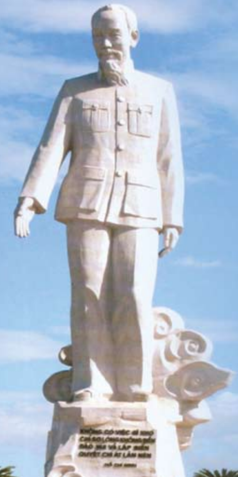
Tượng đài Bác Hồ trên đỉnh núi Ông Tượng

Năm 1962, khi Bác Hồ về thăm tỉnh Hòa Bình, đứng cạnh dòng sông Đà hùng dữ, Bác có nói chuyện với các cán bộ trong đoàn công tác: “Phải biến thủy tặc thành thủy lợi”. Mong muốn chinh phục dòng sông nhằm phục vụ lợi ích lâu dài cho toàn dân của Bác giờ đây đã trở thành hiện thực và vẫn đang từng ngày được các thế hệ đảng viên, CBCNV Công ty Thủy điện Hòa Bình giữ gìn, vun đắp.