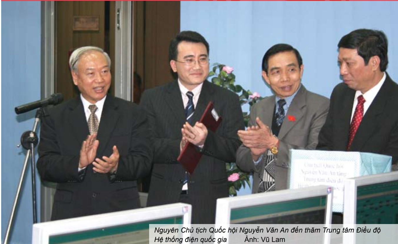
Nguyên Chủ tịch Quốc hội Nguyễn Văn An đến thăm Trung tâm Điều độ Hệ thống điện quốc gia